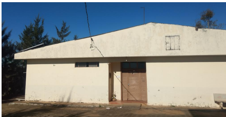
Figura 1. Vista frontal do prédio a ser reformado.

Estrutura do Futuro Espaço Integrado de Pesquisa, Extensão, Inovação e Empreendedorismo do IFSULDEMINAS - Campus Muzambinho, a saber: Espaço Maker, Núcleo Incubador/Coworking, Salas Multiuso (reuniões, apresentações, copa, banheiros, descompressão), Salas de apoio administrativo (secretaria, coworking administrativo).