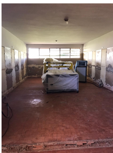
Figura 3. Exemplo de Sala.