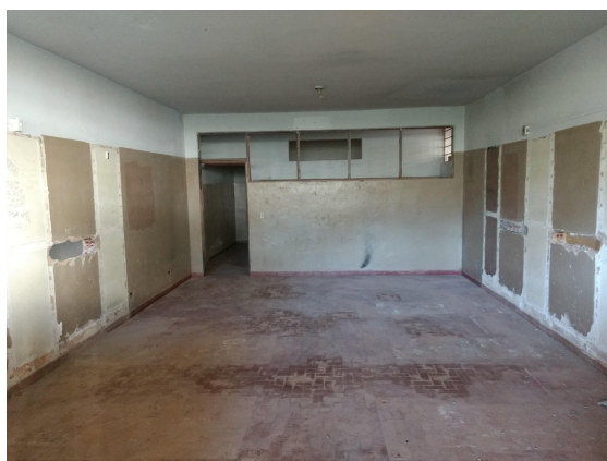
Figura 2. Exemplo de Sala.